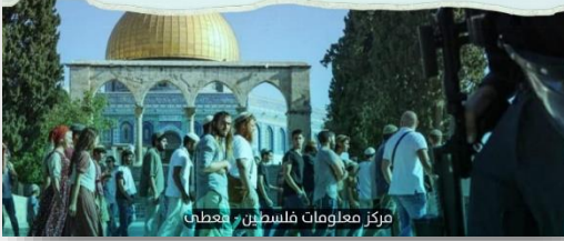
مركز معلومات فلسطين - معطبي

شبكة من الطرق الاستيطانية، تعزز فصل المناطق الفلسطينية، واتصال المستوطنات حول القدس المحتلة.